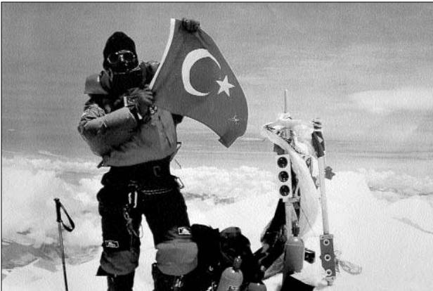
Everest Dağı zirvesinde, 1995