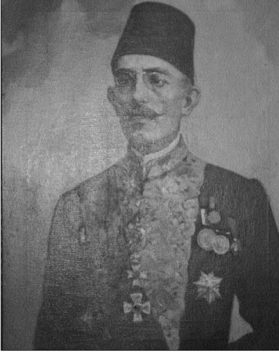
Eşref Cafer Bey