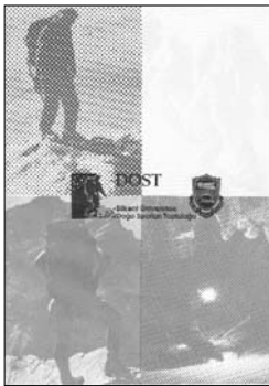
DOST dergisi, 1990 tarihli ilk sayısı...