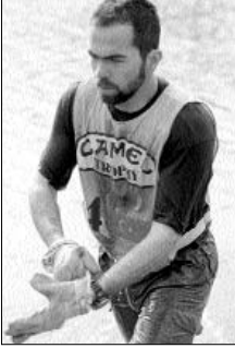
Camel Trophy seçmeleri, 1996