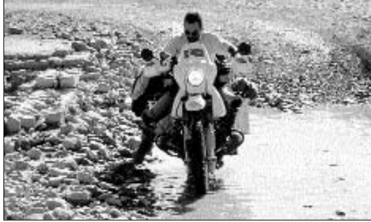
Motosikletle doğu yolculuğu - Pakistan, 1997.