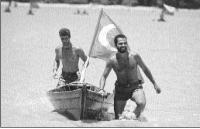
Camel Trophy bitiş etabı, 1996