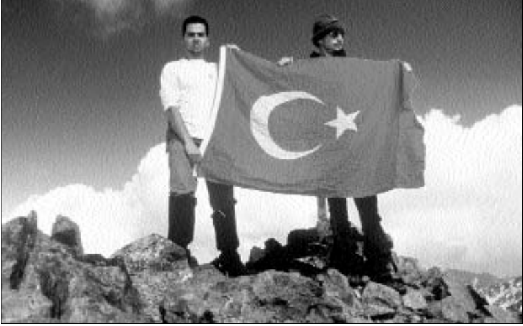
Yıllar önce Kaçkar Dağı zirvesi, 1989