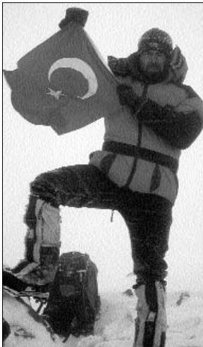
Küçük Ağrı Dağı zirvesi, 2001 kış