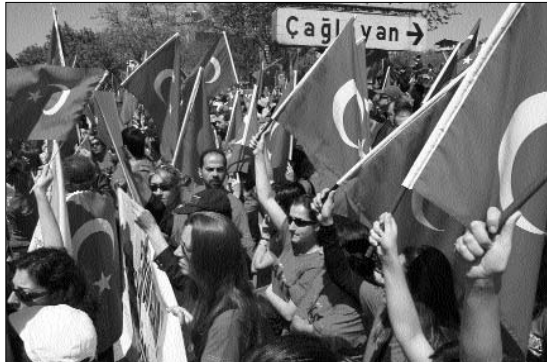
Cumhuriyet Mitingi, Çağlayan Meydanı, 2007