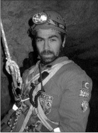
AKUT Yalıköy operasyonundan, 2003