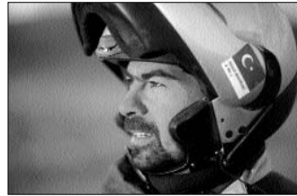
Motosikletle Tibet'te, 2002