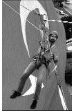
Antalya 19 Mayıs törenleri, 2004