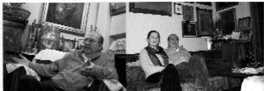
Portreler, yıl 4, sayı 9. s. 3.

Akbulut'un yazdığı yazılarla ilgili hükümlerin uygulanması için yazılmıştır. Akbulut'un yazdığı yazılarla ilgili hükümlerin uygulanması için yazılmıştır. Akbulut'un yazdığı yazılarla ilgili hükümlerin uygulanması için yazılmıştır.