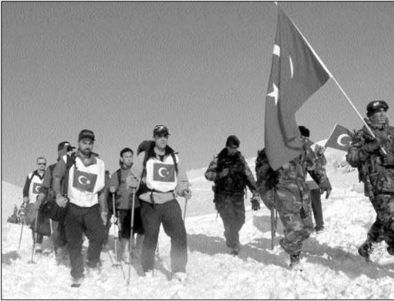
Sankamış Şehitleri'ni anma etkinlikleri, 2004